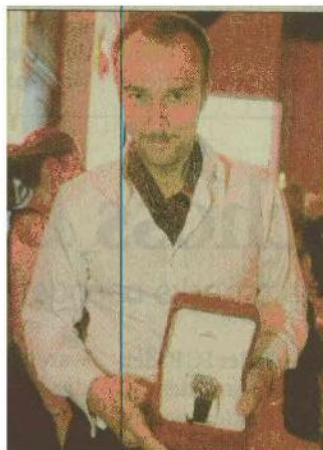
IN RIEHEN Carlos Leal, Schauspieler im neuen «James Bond».

ding war vom schönen Star so angetan, dass sie immer wieder in die Hände klatschte. In seiner Show «Mi Soledad» verbindet der berühmte Tänzer Flamencotanz und -musik mit orientalischen Klängen und Jazz.