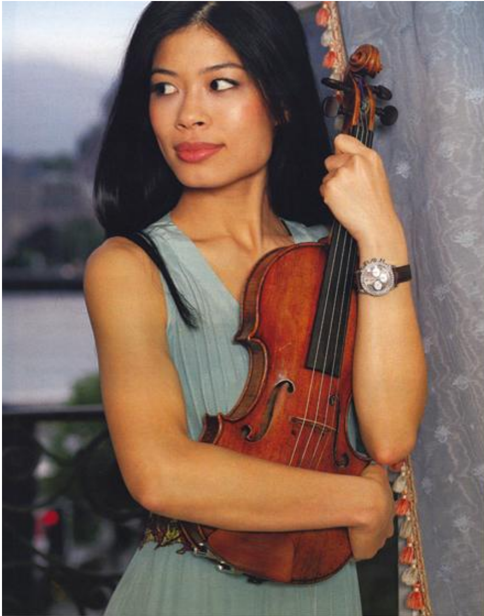
เธอเคยสะสมงานศิลปะ แต่ด้วยเหตุผลว่าเป็นของแพง เธอจึงยุติ ส่วนไวโอลิน มีใช้เป็นประจำของเธอ แต่เป็นงานมากกว่า ตัวโปรดที่ไม่อนุญาตให้ใครแตะเลยนี่ เป็นของ Quadagnini ชาวอิตาลี ทำในปี 1761