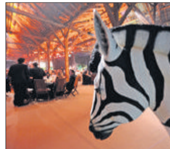
Un dîner gastronomique, dans un décor africain. (CHRISTIAN BRUN)