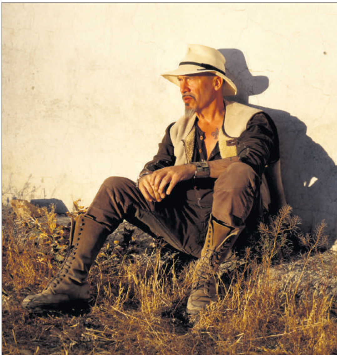
Florent Pagny. Loin de Paris et de son tourbillon, la Patagonie est essentielle à son équilibre. Il s'y rend donc aussi souvent qu'il le peut.