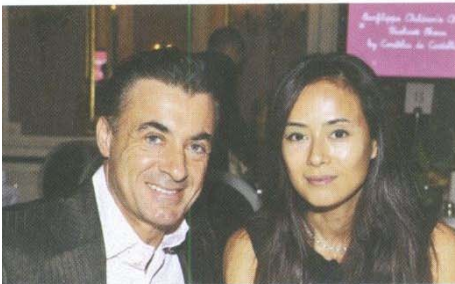
M. Jean Alesi et Mme Kumiko Goto