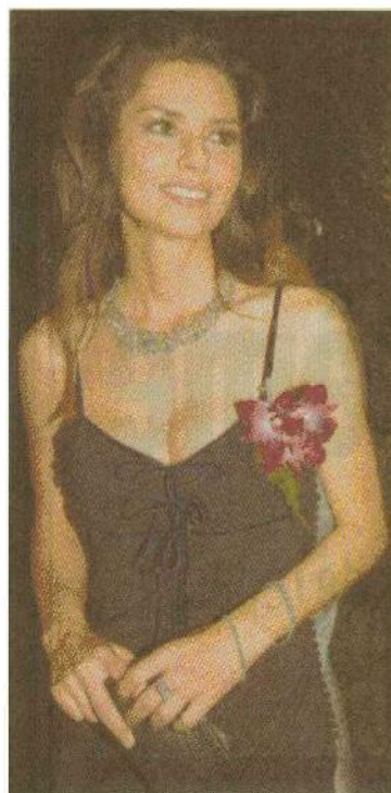
STAR La célèbre habitante de La Tour-de-Peilz, Shania Twain, est venue en voisine à Genève.

L'argent récolté, trois millions lors des quatre éditions précédentes, va toujours aux victimes des catastrophes oubliées. Parmi les cinq tragédies auxquelles le Bal d'hier soir devrait apporter un peu de baume, il y a celle du Swaziland: un enfant sur trois y est un orphelin du Sida et plus de 40% de la population est atteinte du virus HIV. Très mondain le bal a le mérite de le rappeler.